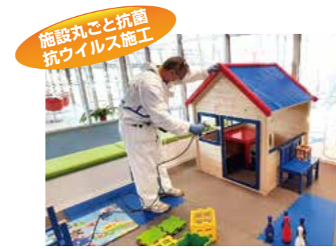
施設丸ごと抗菌 抗ウイルス施工

抗菌防汚、メンテナンスフリーの「ナノゾーンコート」なら下記店舗まで！ ————— お気軽にお問い合わせください。 —————