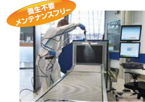
養生不要 メンテナンスフリー