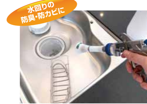
水回りの 防臭・防カビに