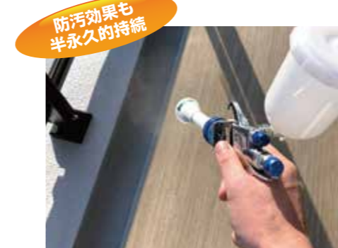
防汚効果も 半永久的持続